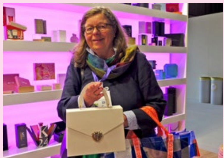
Täuschend echt: die Dolce&Gabbana-Handtasche aus Karton am Stand von Pozzoli.