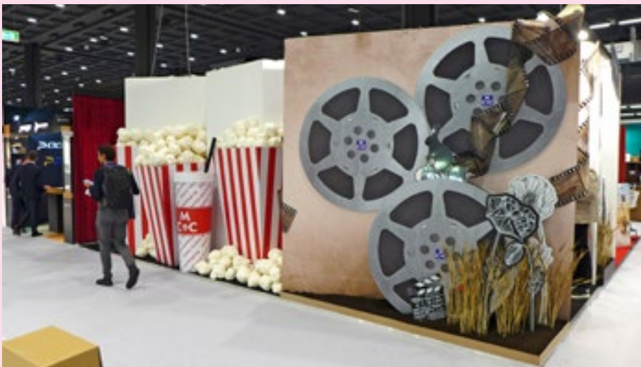
In die Welt des Kinos versetzten große Filmrollen und Popcorn.