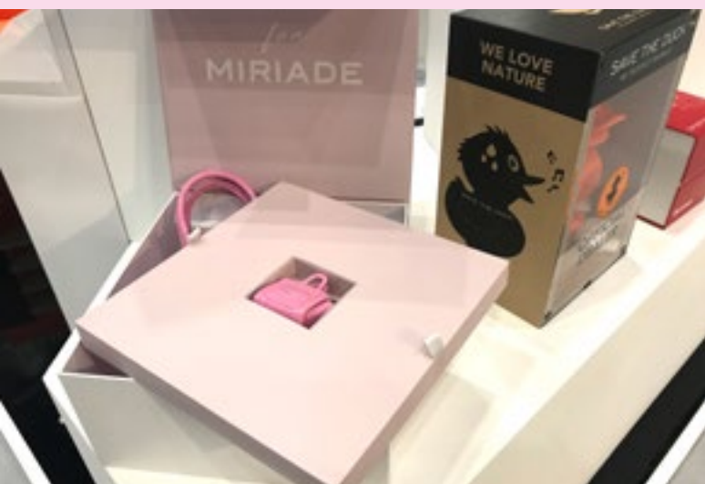
Selbst die kleinsten Luxusgegenstände verlocken zu aufwendig gestalteten Verpackungen.