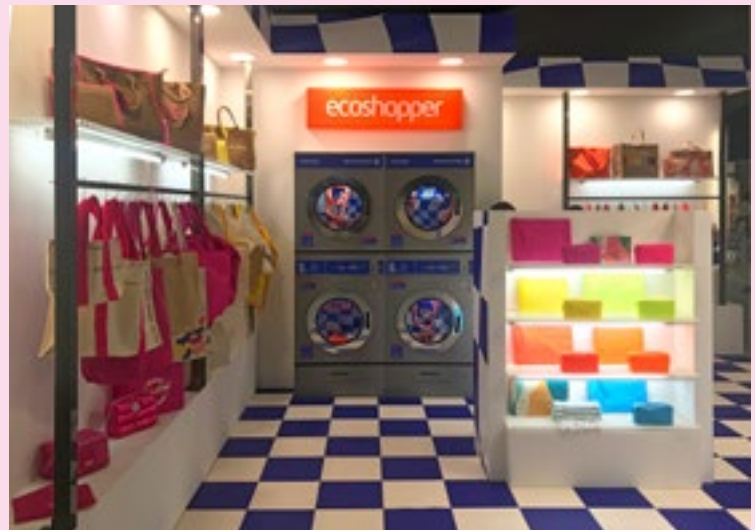
Anmutung Waschsalon: Die Tragetasche aus Recyclingmaterial könne sogar in der Waschmaschine gewaschen werden ...