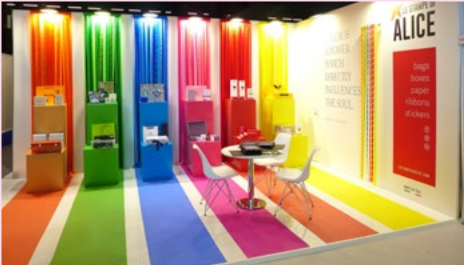
Ein Hingucker aufgrund der farbenfrohen Gestaltung, die offensichtlich auch der Künstler Wassily Kandinsky gutgeheißenen hätte: „Farbe ist eine Kraft, die direkt die Seele beeinflusst.“